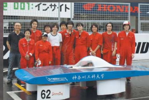
競技用ソーラーカー