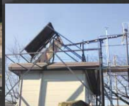
床暖房とソーラーサイフォン 実験施設