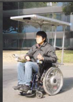
太陽電池と燃料電池を利用した ハイブリッド電動車いす