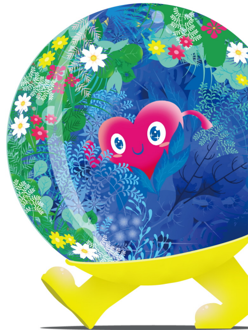
公式マスコットキャラクター トククトゥンク