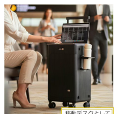
移動デスクとして