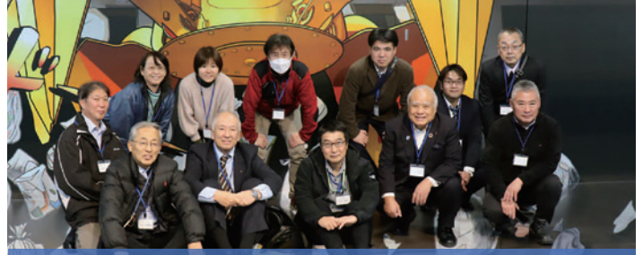
▲あつあいクリーンセンターでの集合写真

厚木市、愛川町、清川村の3市町村で構成する厚木愛甲環境施設組合が主体となって整備した広域ごみ中間処理施設「あつあいクリーンセンター」を訪問し、施設の役割や処理の流れ、環境配慮への取り組みについて理解を深めました。