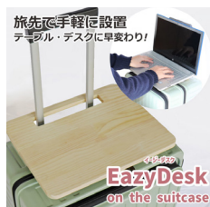
旅先で手軽に設置 テーブル・デスクに早変わり!

内装加工だけでなく、プリントの後加工などができる企業さんがいれば、ぜひ一緒にできることを探していきたいと思っています。また、厚木市のふるさと納税にも参加しており、返礼品としてスーツケースを提供しています。お客様に向けては、修理やアフターサービスを手厚く、そして安く提供できる点が当社の強みになりますので、スーツケースを購入される際には、ぜひ選択肢の一つとして検討していただけたら嬉しいです。